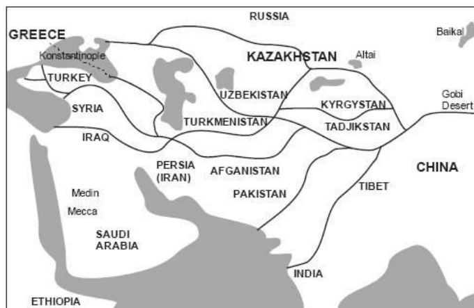
Рисунок 1. Карта-схема Великого шелкового пути.

На территории Евразийского континента, в конце XX - начала XXI века, произошел социальный взрыв в культуре человечества, который обозначил кризис общественного саморазвития. Но, нельзя не заметить, что это оказало существенное влияние на создание философии и мировосприятия. Можно сказать, что данное явление, стало положительным фактором для осознания значимости истоков культуры как сущности бытия и сознания. «Именно в этот период переоценки ценностей всплыл образ Центральной Азии как совершенно уникального источника диалога Востока и Запада, который оказался невостребованным на протяжении долгих столетий» [1].